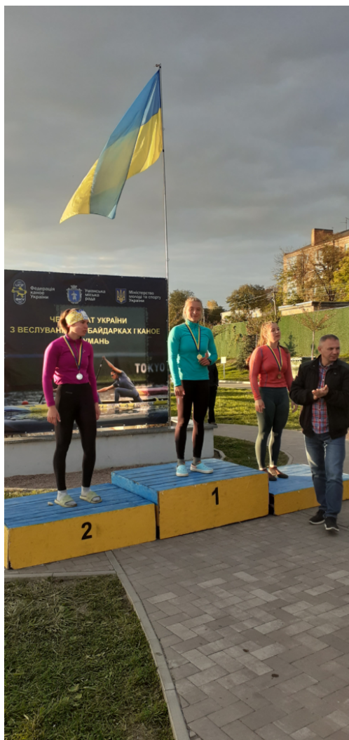
Чемпіонка Ганна Павлова